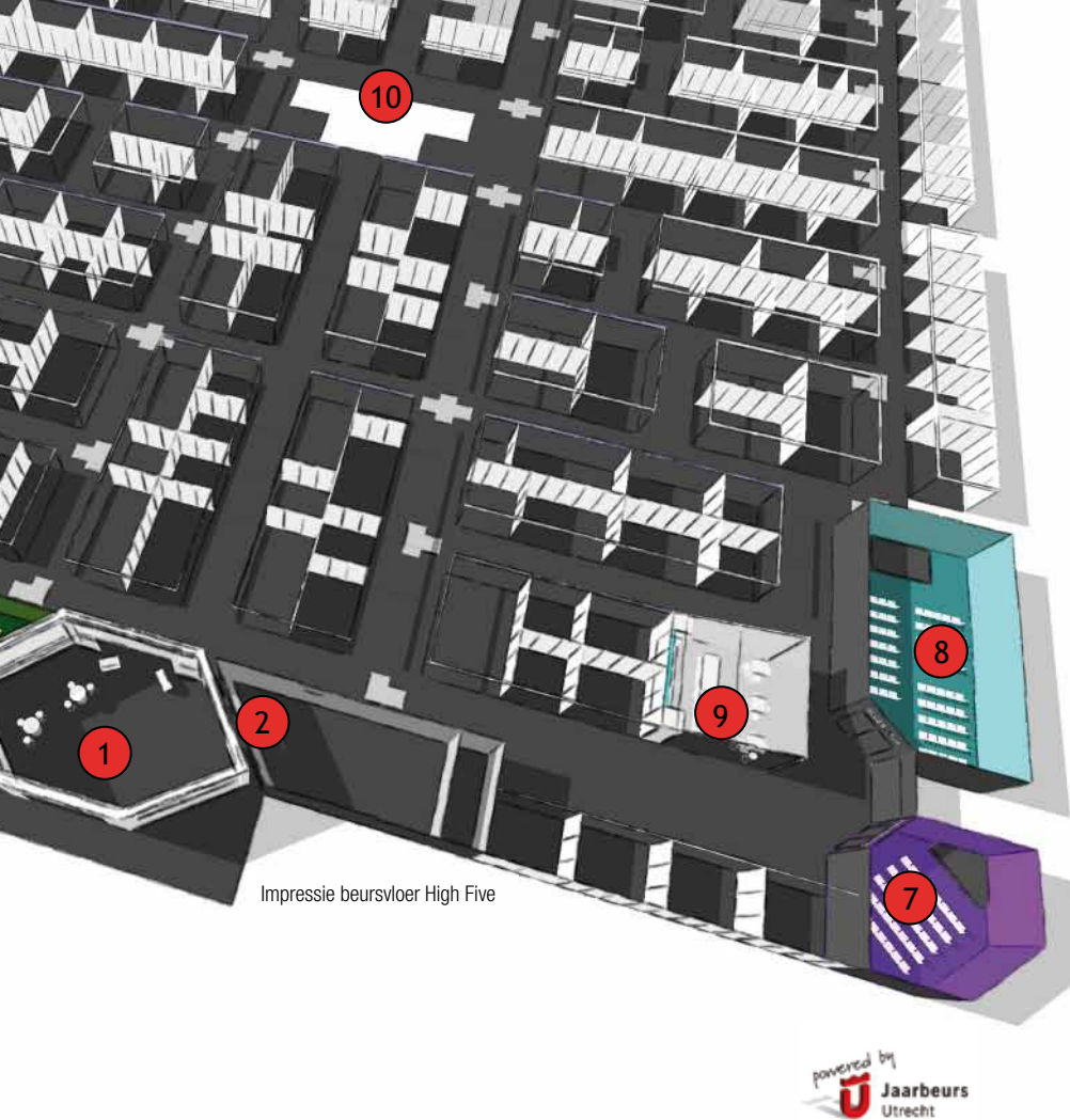
Impressie beursvloer High Five